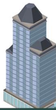
พาณิชย์กรรมและอุตสาหกรรม