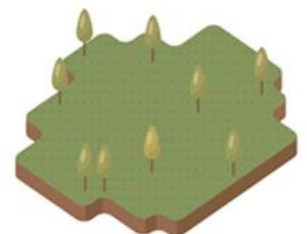
ที่ดินรกร้างว่างเปล่า