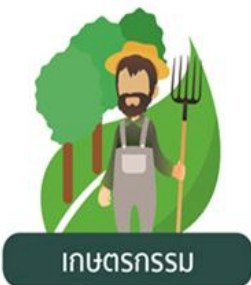
เกษตรกรรม