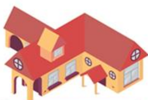
ที่อยู่อาศัย